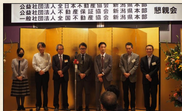
R2年度より入会された7名の皆様