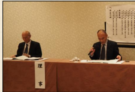
報告事項説明者 常務理事