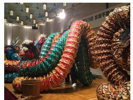
交流会アトラクション 石見神楽(おろち)