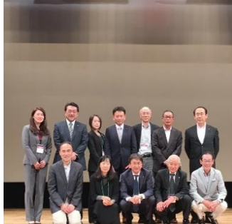
参加者12名で集合写真