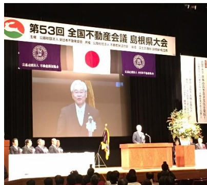
全国不動産会議 開会式の様子